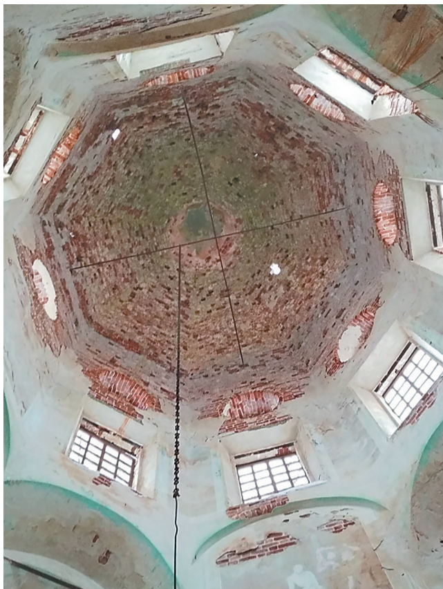
Купол Крестовоздвиженского храма

● Лариса Фабричникова