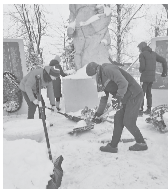
Волонтерский отряд «Медведи»

Мы помним героев, благодаря которым видим мир-