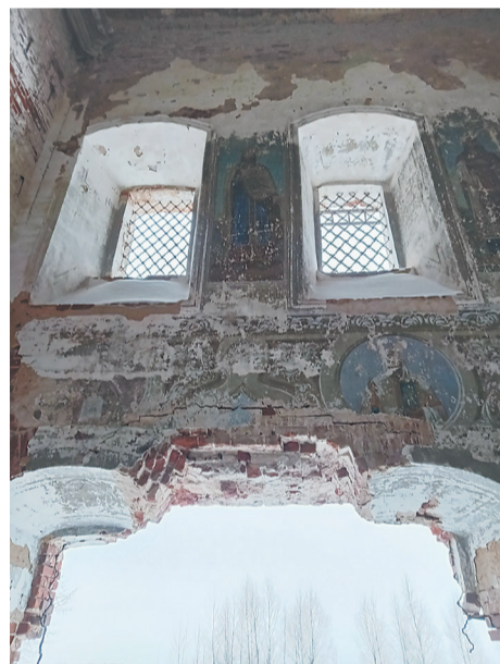
Красота и разруха в Сретенском храме

ния. Пустые глазницы окон, осыпающаяся кладка. Но у храма есть дверь, сделанная чьими-то добрыми руками. Мы вошли в него и увидели аналой с иконами Спасителя, Божией Матери, Михаила Архангела. Алтарь отделен трогательной завесой.