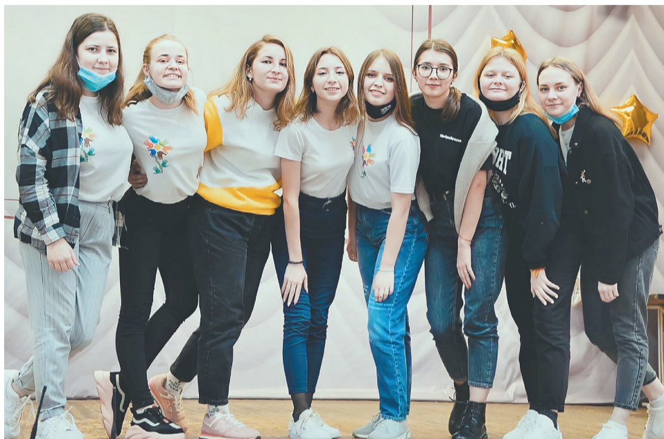
Волонтеры отряда «Добрые руки» в хорошем настроении