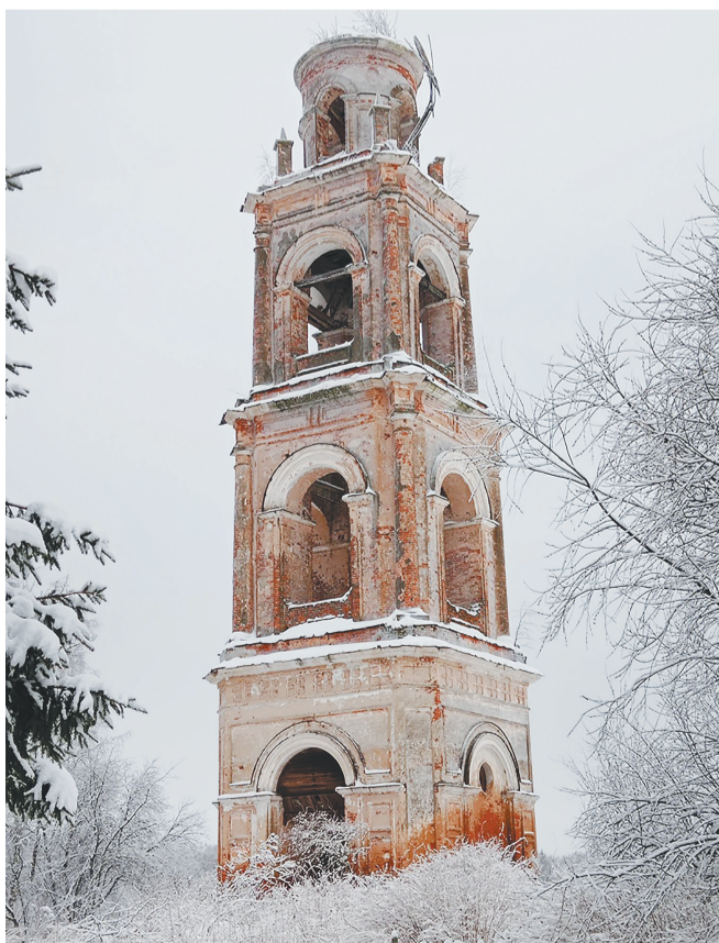
Колокольня Крестовоздвиженского храма в Игрищах