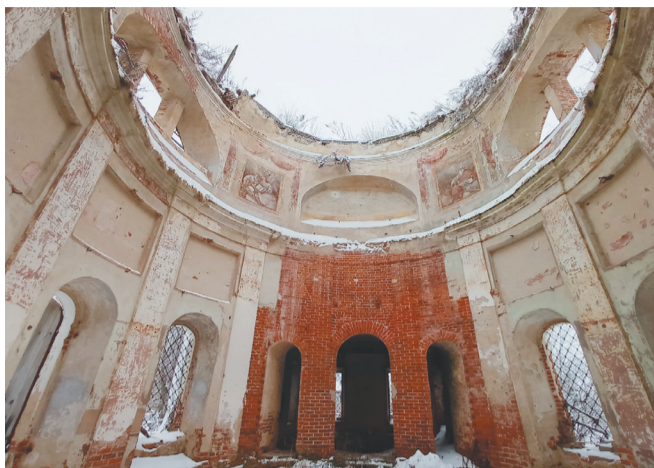
Корсунский храм в Дегтево