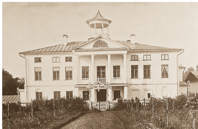
Большой дом усадьбы Карабиха. 1890-е гг.