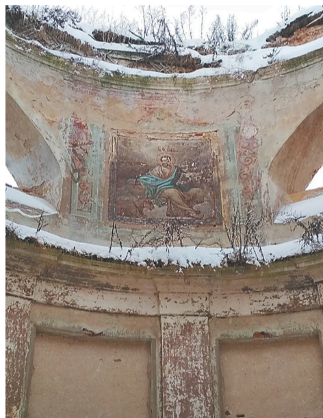
Фреска в Корсунском храме