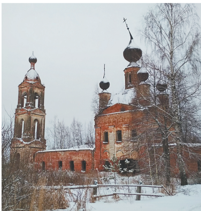
Сретенский храм в Резанино

В завершение нашего паломнического путешествия мы увидели храм Корсунской иконы Божией Матери с приделами во имя святителя Иоанна Златоуста и святителя Николая Чудотворца в Дегтево. Зимняя, тра-